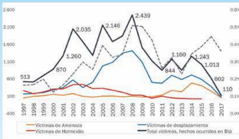
Gráfica 2 Número víctimas de hechos ocurridos en Bogotá*

* Las víctimas de los hechos victimizantes detallados en la gráfica (Amenaza, Desplazamiento y Homicida) representan del 51% al 99% del total de víctimas de hechos ocurridos en Bogotá en el período referido.